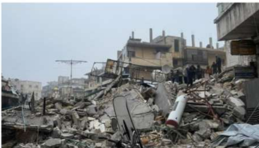
Imágenes del terremoto en Siria | Katreen Ahmad

10 de febrero de 2023 - 14:28h Actualizado el 10/02/2023 - 14:46h