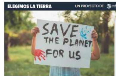
'Elegimos la Tierra', el movimiento global ante la emergencia climática