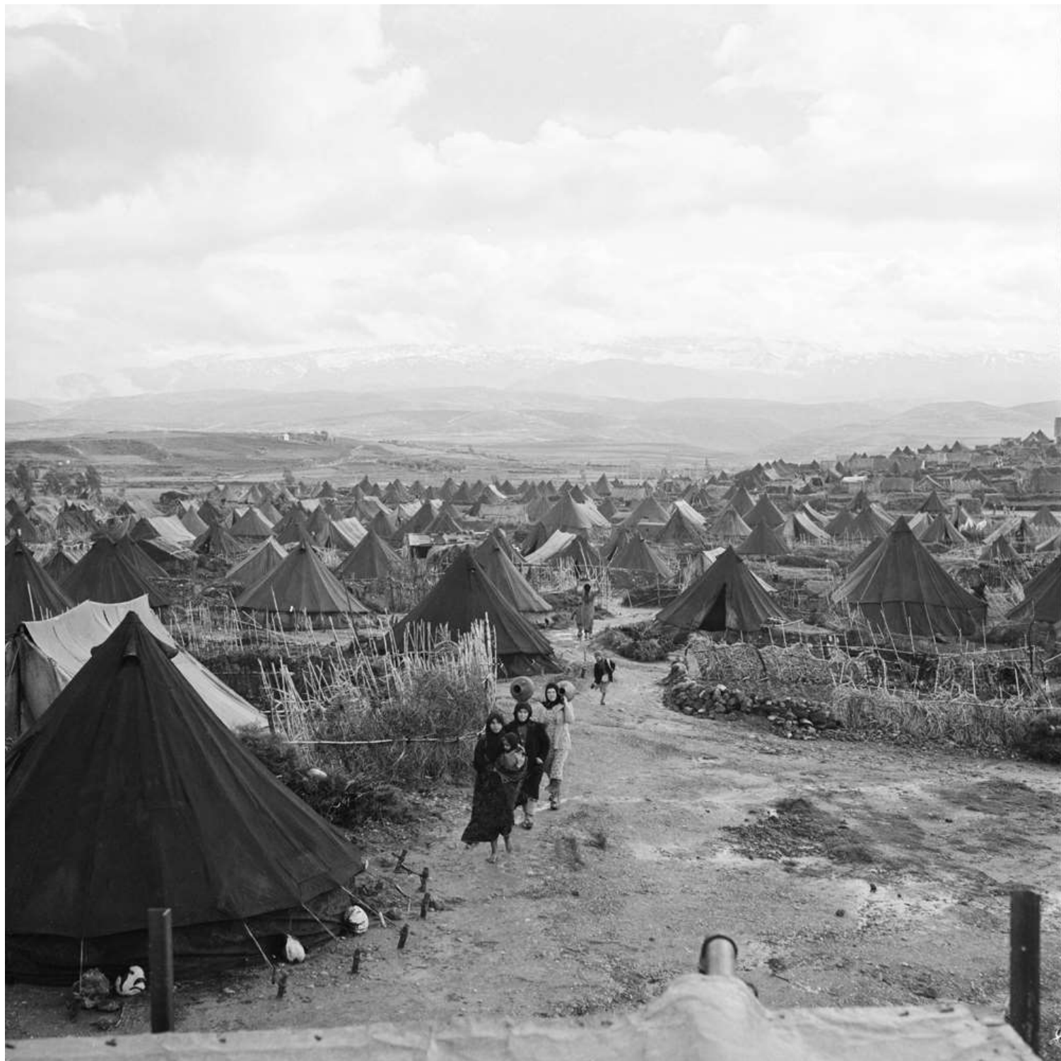
Campaments al Líban